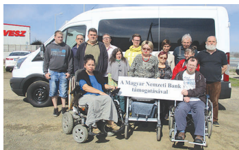
Az Egyesület elnöksége

A támogatott, speciálisan kialakított Ford tranzit típusú gépjármű megvásárlásra került. A gépjármű speciális átalakítását a Mozgáskorlátozottak Egyesületeinek Országos Szövetsége anyagi támogatásával segítette.