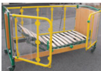
Többféle szempontból variálható, állítható speciális ágyak

A gyógyászati segédeszközökkel, használt alkatrészekkel kapcsolatosan bővebb felvilágosítás kérhető Egyesületünk székhelyén – Nyíregyháza, Tiszavasvári út 41. -, központi telefonszámán – 06-42/410-522 -, valamint Kovács Károly munkatársunknál – 06-20/9308-736 telefonszámon munkanapokon 8-12 óráig .