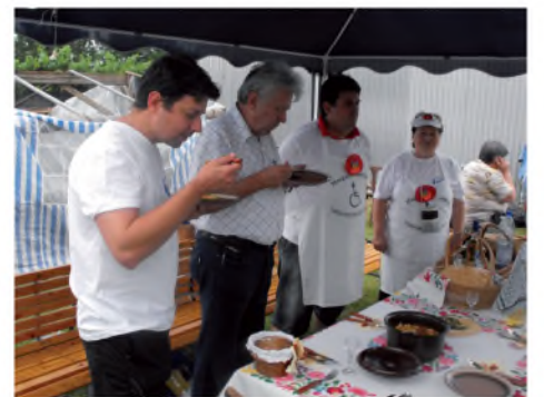
Főzőverseny: munkában a zsűri