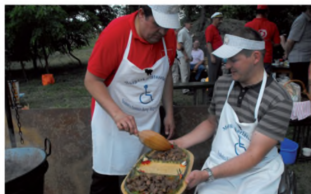
Tálalás a zsűri részére a főzőversenyen