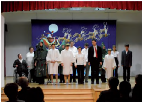
A fiatalok ünnepi műsora

mény fiataljai az alkalomhoz illően egy karácsonyi történetet mutattak be a színpadon, nagy sikert aratva a közönségnél. Végül mindenkinnek ajándékkal kedveskedett az egyesület vezetése.