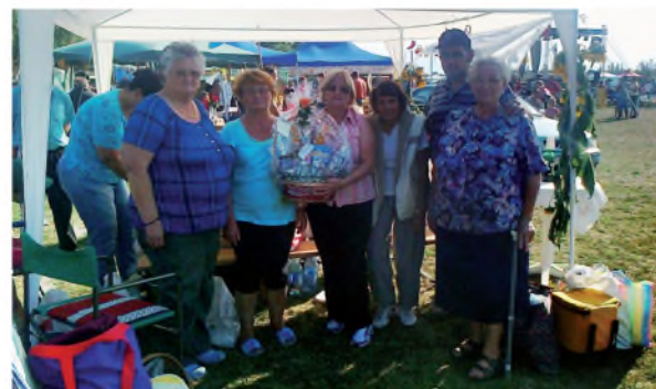
Az eredményhirdetés után

Már hagyományá vált, hogy a Mozgáskorlátozottak Gávavencsellői Körzeti Csoportjának lelkes tagjai beveznek a Buj községben évek óta augusztus utolsó szombatján megtartott „Lecsőfesztivál” főzőversenyére.