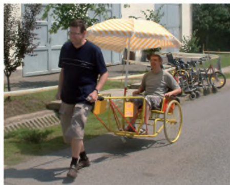
Közkedvelt szórakozási és sporteszköz a kézzel készített roky riksa és kiskocsi a műhelyünkben