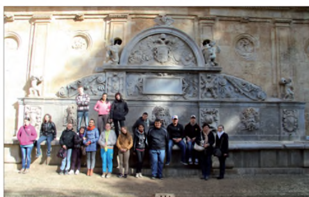
A pihenés pillanatai