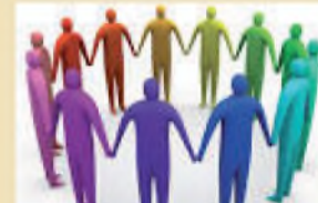
A szeretet energiájában

A Mozgáskorlátozottak Szabolcs-Szatmár-Bereg Megyei Egyesülete mozgássérült és fogyatékosokkal élő tagjai nevében hálás szívvel mond kö-