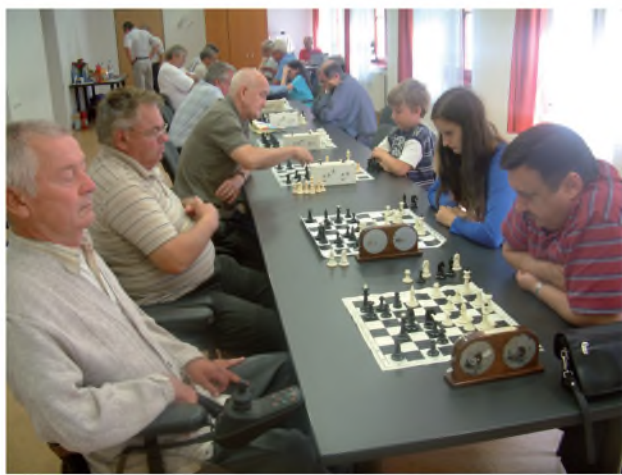
Pillanatképek a versenyről