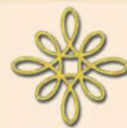
Az összefogás ereje