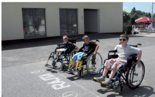
Kerekesszékes ügyességi verseny