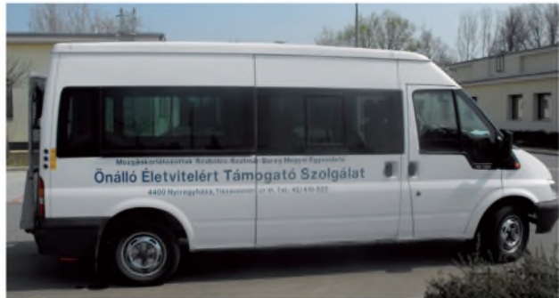
Mozgásban a Támogató Szolgálat autója