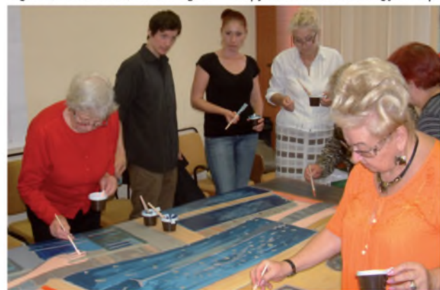
Munkában a Reuma Klub tagjai

A kép darabjait Budapesten, Nyíregyházán, Szombathelyen, Gyulán, Veszprémben, Pécsen, Debrecenben és Szegeden festették. Az óriási panoráma képeslap a GUINNESS WORLD RECORDS elvárásai szerint készült. Anyaga karton, rajta városrészt és ember szerepel, hátoldalán üdvözlés és bélyeg is helyet kapott, kicsinyített mása pedig kereskedelmi forgalomba kerül. Valóban postai úton kell célba juttatni, s a feladatot a Magyar Posta vállalta, amely a kezdeményezés támogatójaként a világ legnagyobb panoráma képeslapjának szállítójává vált.