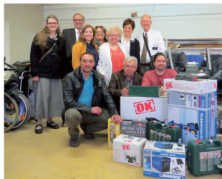
A szerszámok átadása