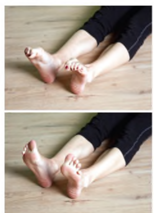
A lábuinjainkat húzza össze („karmolás”), majd nyújtsa ki.