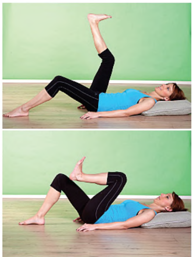
Biciklizzen a levegőben jobb lábbal, majd bal lábbal.