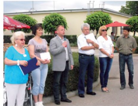
A megnyitó pillanatai

A vidám, hangulatos esemény megkoronázását a főzőverseny és az ügyességi-, illetve sportversenyek eredményhirdetése, a nyertesek és helyezettek megjutalmazása jelentette. Természetesen a részvétel volt a fontos, nem a győzelem, ezért a versenyekben megmérettetett gyerekek, felnőttek egyike sem térhetett haza kisebb ajándék nélkül.