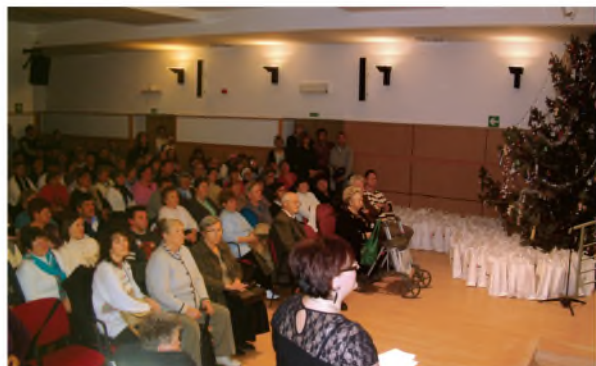
Az ünnepség résztvevői

A Mozgáskorlátozottak Szabolcs-Szatmár-Bereg Megyei Egyesülete 2013. december 13-án karácsonyi ünnepséget rendezett tagjai részvételével Nyíregyházán az Esély Centrumban.