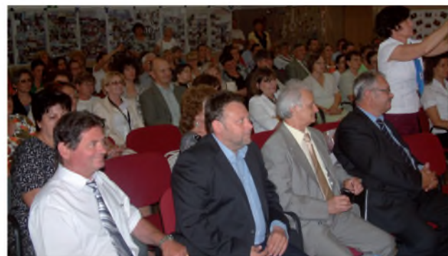
Az előadást hallgató érdeklődők

Jó kezdeményezésnek bizonyult a szervezők által első alkalommal megszervezett speciális állásbörze – bízunk benne, hogy az országban lesz folytatása – biztatott Fülöp Átila helyettes államtitkár.