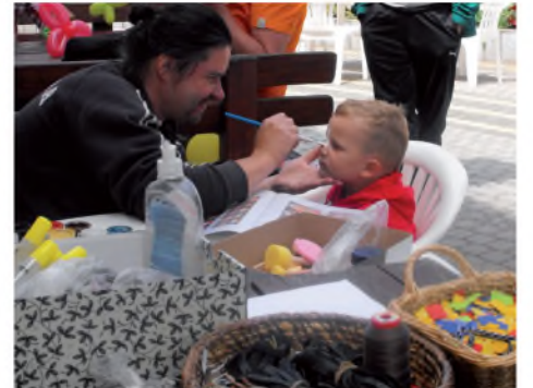
Közkedvelt volt az arcfestés