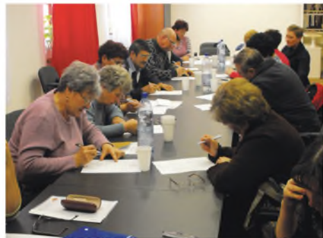
Nagy volt az érdeklődés

kötetlen csoportos és egyéni beszélgetések lehetőségével, szakemberek bevonásával. Célunk: a szülők számára hatékony, szakmailag megalapozott tudás át-