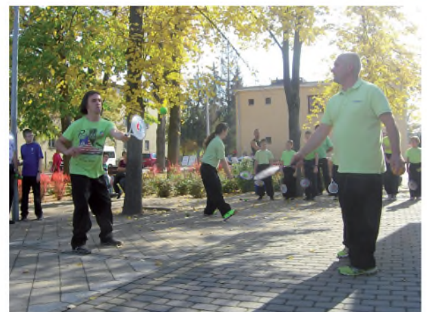
Mediball bemutató az Esély Centrumban