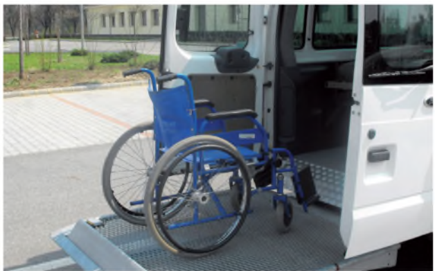
Könnyen megy a beszállás