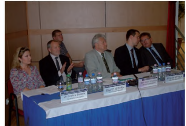
A szakmai előadás résztvevői

Az állásbörzén szakmai előadások hangzottak el, részben az Emberi Erőforrások Minisztériuma, részben a tevékenységet