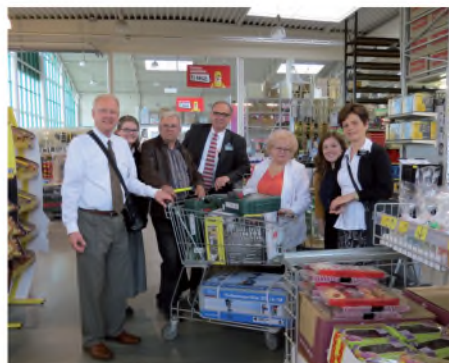
A szerszámok vásárlása