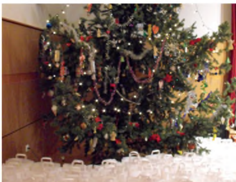
Adományok a karácsonyfá alatt