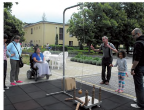
Dőlt a bábu