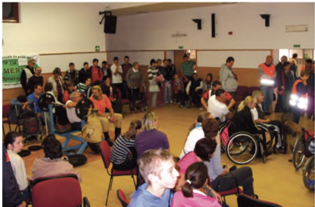
Nagy volt az érdeklődés

MERI napok mintájára szervezte meg tavaly ősszel az ország hat nagyvárosában. A „sportkóstoló” rendezvények célja, hogy a mozgáskorlátozott és fogyatékos-sággal élő emberek megismerhessék a régiójukban elérhető sportolási lehetőségeket és kedvet kapjanak a mozgáshoz, a rendszeres sportoláshoz. A programozatot az Emberi Erőforrások Minisztériuma támogatta, az utolsó sportnapot október 19-én Szegeden rendezték meg.