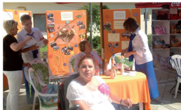
A MK. Sz.-Sz.-B. Megyei Egyesület standja

Az RSZSZ-ek a náluk jelentkező megváltozott munkaképességű dolgozók közül a munkaadói igényeket még nem, vagy alig tudják kielégíteni. Sok esetben hiányos a