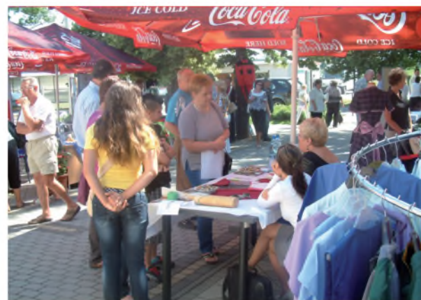
Pillanatkép az állásbörzéről

személyek egy részét megillető, a NAV által kibocsátott, de a Rehabilitációs Szakigazgatási Szervnél (továbbiakban: RSZSZ) igényelhető ún. „Rehabilitációs kártyát”, mely jelentősen kedvezőbb teszi az érintettek elhelyezkedési lehetőségét. Ilyen esetben a munkaadó mentesül a munkavállalójának bérköltségét terhelő járuléki megfizetése alól. Ezt bármely munkaadó minden