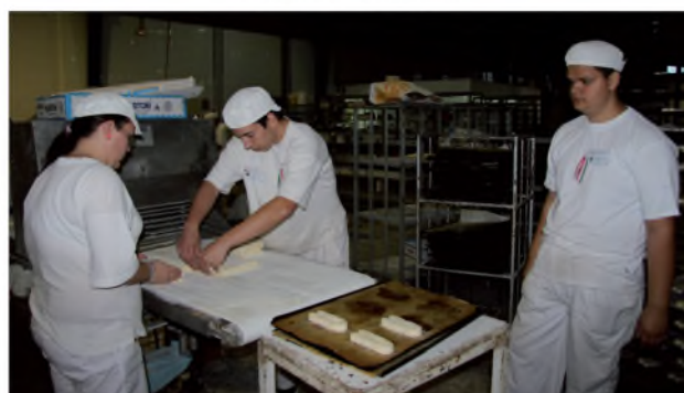
Munkában a pék tanulók