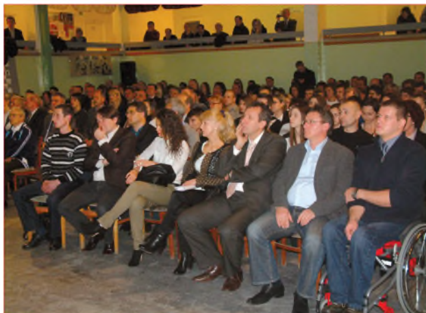
A sportgála résztvevői