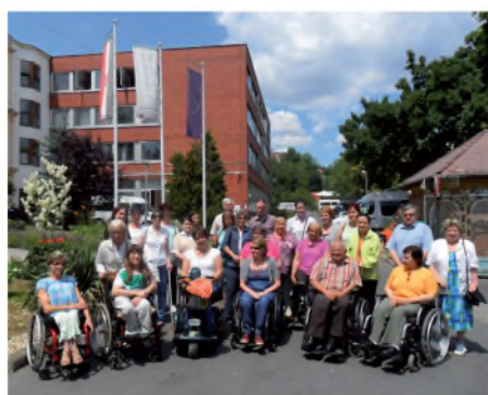
SOTA képzés, Budapest