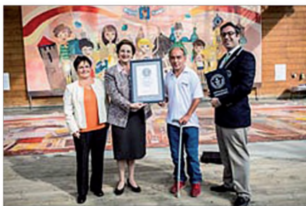
Hivatalosan is megszületett a rekord

A teljes képet az Arthritis Világnapján, a Millenárison egy ünnep-