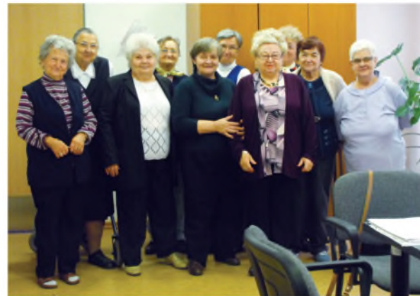
15 éve együtt

2013-ban is, mint minden évben, havonta tartottuk az összejöveteleinket.