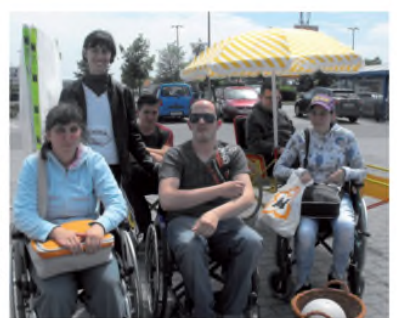
Sportnap a Tesco-nál

További információ: a +36-20/250-0188- as telefonszámon kérhető!