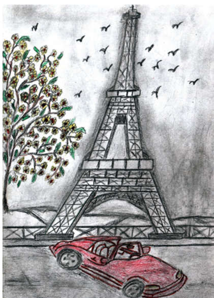
Abai Anita rajza